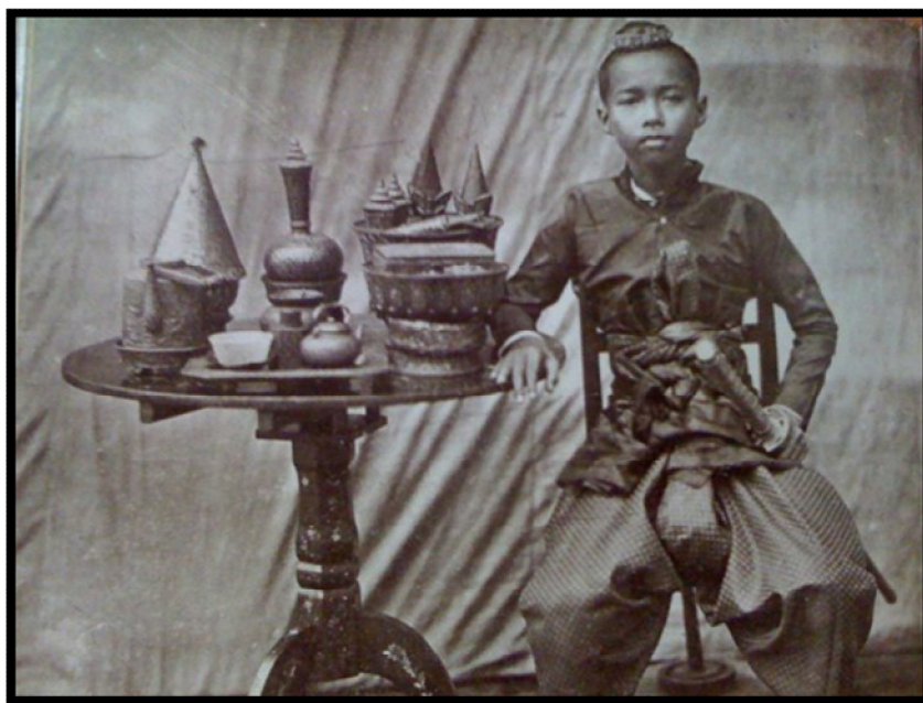
พระบาทสมเด็จพระจุลจอมเกล้าเจ้าอยู่หัวรัชกาลที่ 5 เมื่อครั้งยังทรงเป็นสมเด็จพระเจ้าลูกยาเธอ เจ้าฟ้าจุฬาลงกรณ์ ตามเสด็จพระบาทสมเด็จพระจอมเกล้าเจ้าอยู่หัวประพาสเมืองจันทบุรีเมื่อ พ.ศ. 2401 พระชนมายุ 5 พรรษา