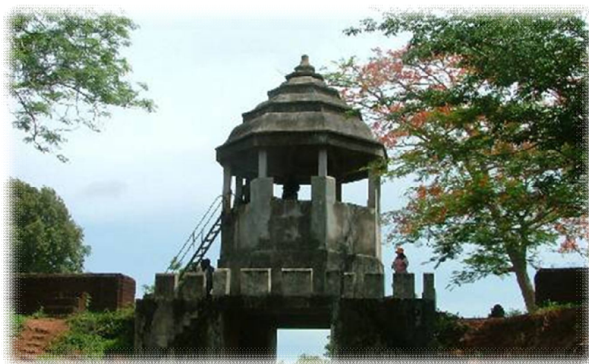
พ.ศ. 2419 เสด็จประพาสจันทบุรี โดยเสด็จผ่านเขาพลอยแหวน ค่ายเนินวง และตลาดเมืองจันทบุรี